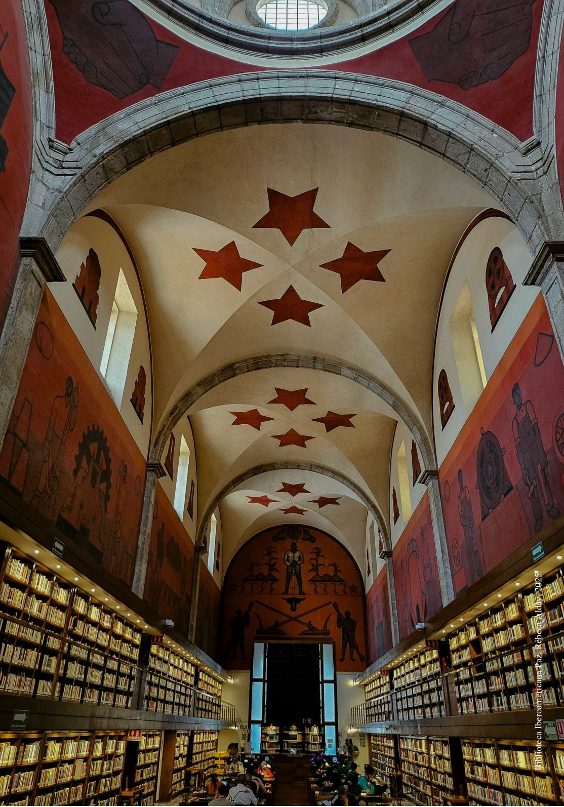
Biblioteca Iberoamericana Paz y Robles, Madrid, 2022