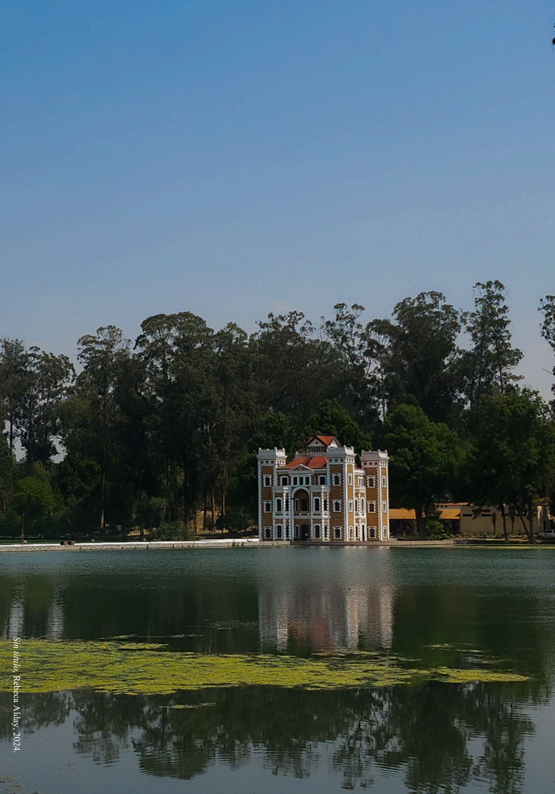
Sin título , Rebecca Alday, 2024.